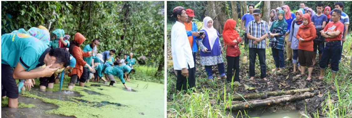
Gambar 2. Ritual Adat Nyipuh di Hutan Keramat

menyipuh diri di kawah pamarekan. Nawur dalam adat Kuta merupakan perlambang mau berkorban