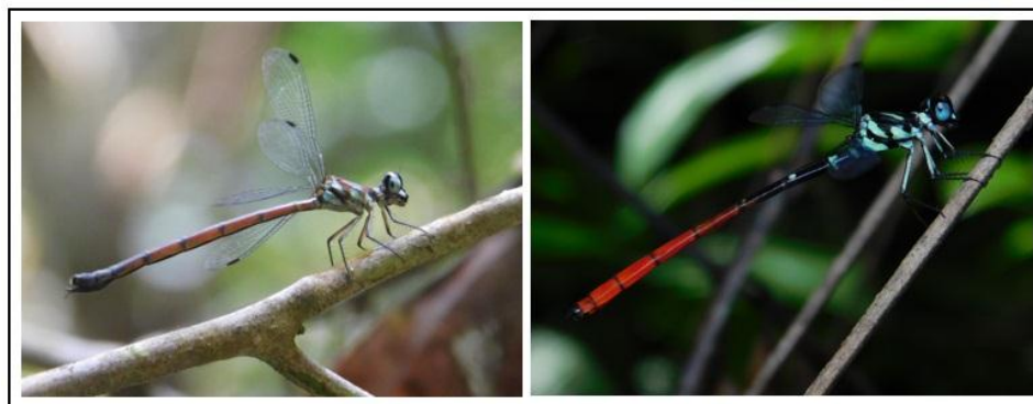
Gambar 2. Rhinagrion tricolor jantan dan betina yang dijumpai di pulau Nusakambangan

Terdapat jenis endemik Jawa yang dijumpai pada saat pengambilan data, yaitu Heliocypha fenestrata , Prodasineura delicatula , Rhinagrion tricolor , Nososticta insignis dan Drepanosticta sundana . Lieftinck (1934) menjelaskan terdapat 5 jenis anggota genus Drepanosticta endemik di Pulau Jawa. Terdapat temuan capung menarik dari jenis-jenis endemik pada penelitian ini. Zaman et al (2017) mencatat bahwa Rhinagrion tricolor merupakan capung endemik jawa yang sudah lama tidak ditemui, terakhir perjumpaan yaitu pada tahun 1958.