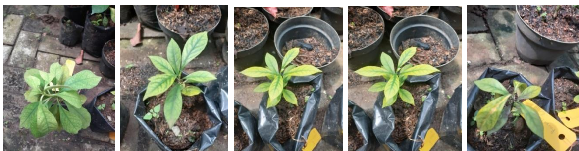
Gambar 2 : Anakan R.serpentina di Pembibitan Gedung IX Kebun Raya Bogor

R.serpentina adalah tanaman herba yang merupakan hasil eksplorasi di daerah Wonogiri tahun 2018, dan ditanam dalam polibag, pertumbuhan tanaman ini kurang begitu bagus, daunnya berwarna hijau kekuningan, meskipun mampu menghasilkan bunga dan buah. Bulan April 2019 tanaman ini mati kering, namun ada anakan hasil perbanyakannya biji yang disemaikan bulan Oktober 2018 sebanyak 2 anakan, namun dalam perkembangannya 1 anakan mati karena terserang hama kutu putih. Juga ada anakan dari R.serpentina yang tumbuh diantara akar tanaman koleksi kawista di Vak XXIV.A sebanyak 5 anakan hasil perbanyakannya biji yang disemaikan bulan November 2019 (Gambar 2).