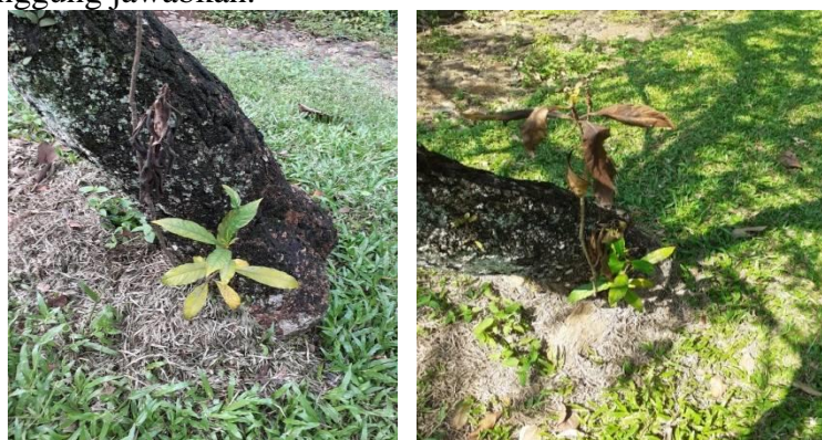
Gambar 5 : Proses Pengeringan tanaman R.serpentina menuju matinya tanaman

Menurut Haryono, W (2013) tanaman R.serpentina mampu bertahan untuk dipanen akarnya antara 3 -5 tahun terutama pada tanaman yang tumbuh di tanah yang gembur dan subur. Hasil pengamatan terhadap kemampuan hidup R.serpentina yang tumbuh meliar di bawah pohon kaswista dan tetap berproduksi berlangsung selama 3 tahun. Hasil pengamatan terhadap kelangsungan hidup tanaman R.serpentina pada akhir tahun 2019 mulai September batang utama setelah buah masak, batang dan daunnya mengering secara perlahan, dan pada November 2019 cabangnya setelah buah masak mengalami hal yang sama mengering dan akhir Desember tanaman ini kering seluruhnya (Gambar 5). Pengamatan terhadap kemampuan tumbuh tanaman ini terus dilanjutkan sampai 17 Maret 2020, tanaman tidak tumbuh lagi dan tanggal 1 April 2020 akarnya kering. Namun mengingat tanaman R.serpentina yang dapat teramati baru 1 tanaman, perlu dilakukan pengamatan ulang terhadap tanaman R.serpentina lainnya yang ada di pembibitan gedung IX Kebun Raya Bogor agar diperoleh data yang benar dan dapat dipertanggung jawabkan.