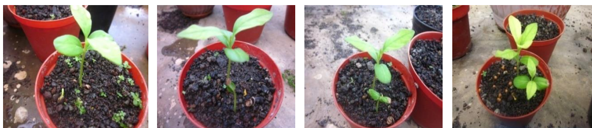
Gambar 4 : Proses dan Tipe Perkecambahan Biji serta Pertumbuhan anakan R.serpentina

Pertumbuhan dari kecambah sampai terbentuknya bibit sangat lambat, bibit dari kecambah pertama dengan umur sekitar satu setengah tahun tingginya tanaman baru mencapai 10 – 15 cm, dengan jumlah daun sekitar 10 - 14 helai, batang kokoh serta warna daun hijau kekuningan. Kondisi ini diduga karena bibit tersebut ditempatkan di rumah kaca. Pertumbuhan bibit – bibit yang ke dua inipun lambat, sampai tanggal 17 maret umur 8 bulan tingginya sekitar 8 cm dengan jumlah daun 8 – 10. Kondisi ini sesuai dengan apa yang disampaikan Mrunalini & Khobragade (2016) dan Sing, P et al. (2018) yaitu bahwa proses pertumbuhan dari kecambah menjadi bibit sangat lambat. Sing, P et al. (2018) melaporkan proses pertumbuhan tersebut berlangsung selama 18 bulan. Mrunalini & Khobragade (2016) menambahkan bahwa cara perbanyak dengan biji adalah cara terbaik yang dilakukan untuk budidaya R.serpentina .