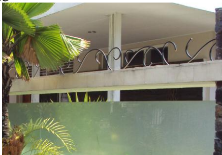
Gambar 6. Desain Teralis Pengaman

Sisi balok yang atas diberi penghalang tralis yang didesain seperti sulur tanaman. Tujuannya adalah untuk mengurangi resiko melompat ke dalam, namun tidak memberikan kesan seram ke arah luar. Untuk sisi yang bergubungan dengan tetangga dibuat dari papan semen yang diberi jarak yang memungkinkan view tetap terlihat bebas sehingga memudahkan untuk menjalin silaturahmi dengan tetangga tanpa harus keluar rumah. Papan semen dibuat bolak balik agar tidak ada kesan bahwa pagar hanya terlihat baik dari sisi rumah pemilik namun juga baik terlihat dari sisi tetangga.