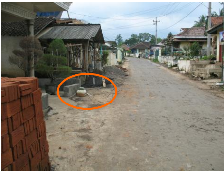
Gambar 3. Pagar di daerah Pedesaan Kabupaten Malang

membuat pagar jadi lebih menarik. Transparansi pagar ini juga menjadi cerminan karakter pemilik, utamanya yang pagarnya memang dibuat atas keinginan pemilik hunian, bukan pagar yang telah dibuatkan dari developer perumahan. Beberapa hunian di daerah ini juga didesain tertutup dengan bahan pagar dari batu alam masif dengan tinggi 120-150cm.. Namun di beberapa sisi tetap dipadukan dengan pagar besi dan vegetasi, sehingga membuat tampilan pagar tetap menarik. Kelemahannya adalah, yang lebih dominan terlihat adalah tampilan pagar dan menutupi bangunan sampai sekitar separuh fasade hunian, namun desainnya tetap menyatu dengan hunian. Sewaktu mencoba bertamu, karakter penghuni memang ada sedikit perbedaan dengan pemilik pagar transparan, tapi hanya berlangsung sesaat, setelah itu, sikap mereka kembali wajar dan baik, seperti indahnya desain pagar mereka.