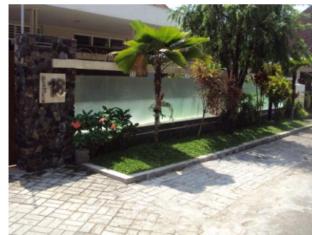
Gambar 5. Hasil Akhir Pagar

Pagar dibuat dengan ketinggian 150cm namun dibuat transparan agar kesan tingginya bisa dihilangkan. Desain utama pagar menggunakan kaca 12mm tempered dengan tujuan untuk memberikan kesan transparan namun tetap diberi lapisan buram agar aktifitas di dalam pagar tetap samar-samar untuk menutup aurat pengguna dari orang jauh (selain tetangga). Untuk melindungi kaca, diberi balok di atasnya namun diberi jarak sekitar 10cm untuk tetap mempertahankan transparansi. Dasar lain penggunaan kaca adalah karena kaca adalah bahan yang relatif mudah pecah dan mengeluarkan bunyi saat dipecahkan. Berdasarkan hal tersebut diambil resiko untuk menjadikannya sebagai pagar agar pencuri menjadi lebih berfikir untuk masuk ke dalam, selain dengan dibuat transparan, sehingga tidak menarik lagi minat orang untuk masuk ke daerah dalam pagar. Namun aplikasi kaca yang digunakan sebelumnya sudah diuji dengan dilembari batu dan