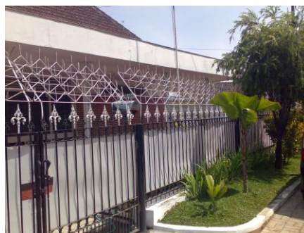
Gambar 2. Pagar yang akan Direnovasi

Objek studi berada di Malang dengan tampilan awal seperti gambar berikut: