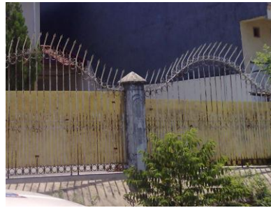
Gambar 1. Pagar dengan Arah Runcing ke Luar, memberikan Citra dan Kesan Buruk

Pagar, memberikan suatu ruang kisaran energi bagi pengguna. Dalam teritori pagar itulah terjalin hubungan energi timbal balik antara penghuni yang ada di dalamnya. Dalam pagar itu pula ada interaksi energi antara orang luar dengan penghuni, yang akhirnya beberapa penghuni tidak menyadari bahwa karakter mereka terkait dengan dunia luar sangat kuat tereksperikan ke pagar. Bahkan sistem pewarnaannya pun menggambarkan citra penghuni.