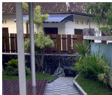
Gambar 7. Pagar ke Arah Tetangga

Setelah selesai pengerjaan, kemudian dilakukan pengamatan purna huni untuk pagar. Sampai saat ini setelah dibangun di tahun 2010, alhamdulillah tidak terjadi hal-hal buruk terhadap penghuni. Bahkan penghuni dapat menjadi lebih akrab dengan tetangga, karena desain semitransparan pagar yang memungkinkan lebih mudahnya silaturahmi dengan tetangga yang lewat maupun yang melakukan aktifitas di halaman mereka.