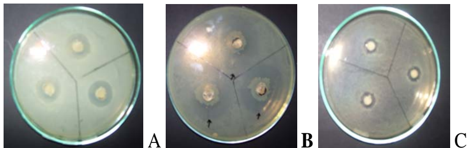
Gambar 3. Penghambatan isolat terhadap S. aureus ATCC 25923 (A). Isolat SS13, (B) Isolat RS1, (C). Isolat RS6