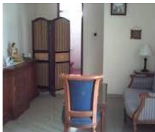
Gambar 4: contoh hijab non permanen