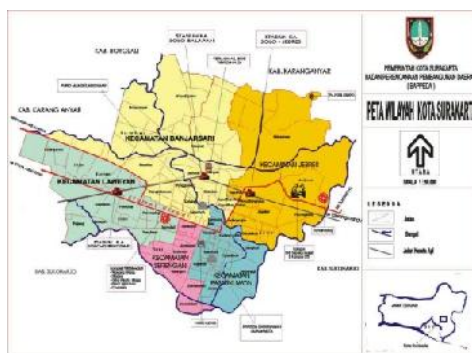
Gambar : Peta Kota Surakarta

Tujuan penelitian ini adalah mengetahui karakteristik rumah tinggal dengan pendekatan nilai islam. Lokasi yang dipilih adalah rumah tinggal masyarakat muslim di Surakarta yang merupakan obyek potensial untuk dapat digali dan di eksplere nilai-nilai Islami pada rumah tinggalnya. Kota Surakarta merupakan salah satu kota di Jawa Tengah yang terdiri dari berbagai keanekaragaman budaya dan wisata di dalamnya. Terbagi dalam 10 sub wilayah Pengembangan (SWP), dengan luas wilayah Administratif 4.404,06 Ha. Secara otonomi kota surakarta berada di antara 110 – 111 BT dan 7-8 LS. Terdiri dari 5 Kecamatan serta 51 Kelurahan. Memiliki luas kawasan yang terbangun mencapai 88,47% atau 3,896 Ha dan kawasan yang belum terbangun sekitar 11,53% atau 508 Ha. Penelitian tentang rumah tinggal pada lokasi ini diharapkan dapat ditemukan konsep rumah tinggal Islami yang dapat dijadikan acuan dasar membangun.