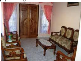
Gambar 3: contoh hijab permanen

Ruang tamu adalah ujung tombak silaturahmi dengan orang diluar keluarga inti yang nonmuhrim . Menurut aturan Islam dikenal adab bertamu dan menerima tamu dengan memperhatikan aturan berhijab bagi laki-laki nonmuhrim . Pada prinsipnya rumah adalah aurat, sehingga tidak dinampakkan pada orang luar, terkait dengan privasi penghuni rumah, karena Islam sangat memperhatikan privasi masing-masing anggota keluarga. Hijab adalah tabir pemisah yang digunakan untuk menghalangi pandangan untuk menjaga kesucian pandangan antar nonmuhrim, dapat berupa hijab permanen maupun non permanen. Gambar 3 menunjukkan contoh pemakaian hijab atau pemisah permanen berupa tembok, sedangkan Gambar 4 menunjukkan contoh pemakaian hijab non permanen berupa tabir pembatas, sketsel, "rono" dalam bahasa jawa. Boleh memakai benda pajangan seperti buffet, almari yang cukup bersifat menutup pandangan.