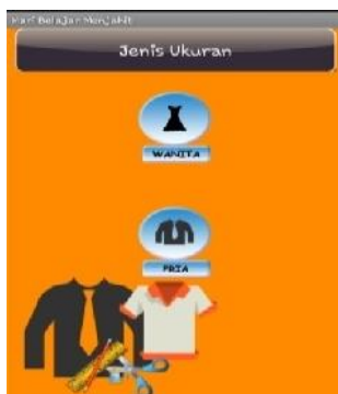
Gambar 7. Interface Jenis Ukuran

Tampil data ukuran merupakan tampilan yang terdiri dari data ukuran yang langsung diambil dari database sesuai nama yg dipilih, di bagian bawah terdapat 3 button yang terdiri dari Simpan, Hapus, dan Keluar. Pengguna dapat langsung mengubah data ukuran dan menyimpannya kembali.