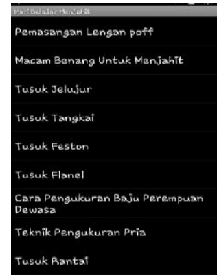
Gambar 3. Interface List Materi Dasar Menjahit