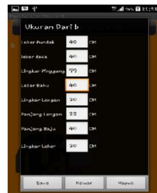
Gambar 9. Interface List Ukuran Pria/Wanita