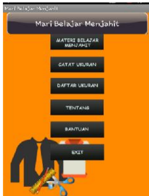
Gambar 1. Interface Menu Utama