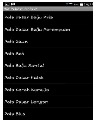
Gambar 5. Interface List Kumpulan Pola Dasar