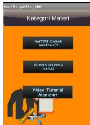
Gambar 2. Interface Kategori Materi