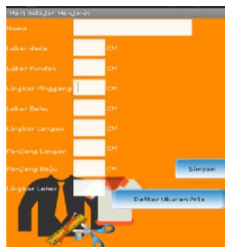
Gambar 8. Interface Input Ukuran Pria/Wanita