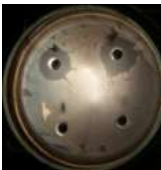
Kontrol (+) (-)