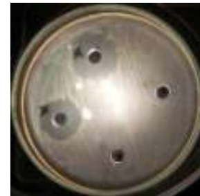
Kontrol (+) (-)