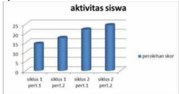
Gambar 2. Peningkatan Aktivitas Siswa Siklus 1 dan 2

sekurang-kurangnya baik. Berikut diagram peningkatan aktivitas siswa pada siklus 1 dan 2 dengan masing-masing pertemuan.