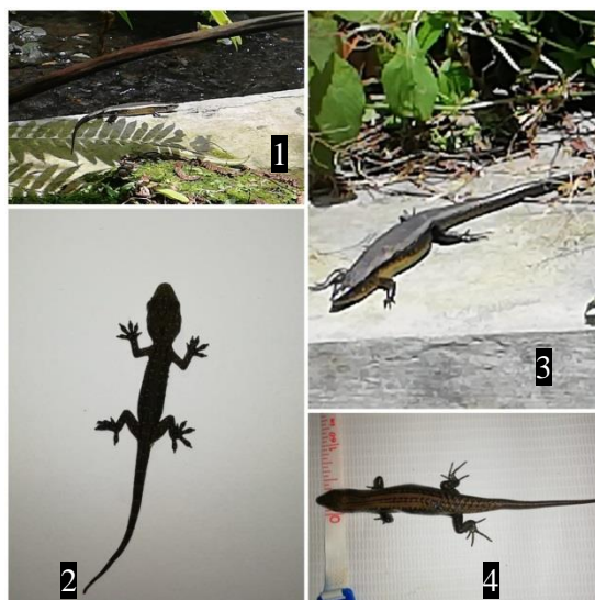
Gambar 2. (1) Eutropis sp. ; (2) Cyrtodactylus marmoratus ; (3) Eutropis sp. ; (4) Eutropis multicarinata

Dari data yang diperoleh, dilakukan analisis berdasarkan data konservasi menurut data IUCN untuk mengetahui status konservasi pada setiap specimen yang ditemukan. Berdasarkan data IUCN, semua jenis spesies yang ditemukan memiliki status konservasi LC (Least Concern) yaitu beresiko rendah. Hal ini berarti jenis spesies tersebut masih banyak dan tidak terancam punah. Status LC merupakan status flora dan fauna yang diberikan oleh IUCN karena tidak memenuhi kriteria EX (kepunahan), EW (punah di alam liar), CR (kritis), EN (kondisi genting), dan NT (hampir terancam).