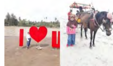
Gambar 4. Aktivitas Pengunjung

Dengan adanya pembangunan di tepian air akan menciptakan berbagai jenis aktivitas sehingga akan menciptakan beberapa komunitas yang menggunakan sarana dan prasarana yang telah tersedia