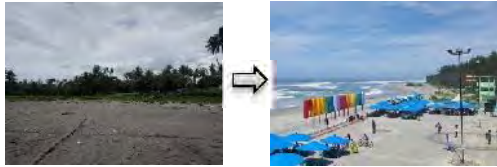
Gambar 10. Ketersediaan Ruang Publik

Konsep rencana mengoptimalkan pemanfaatan tepi pantai tapak batu untuk wisata rekreasi dalam mendukung Bengkulu Utara sebagai waterfront city yaitu menggunakan konsep ramah lingkungan yang mengutamakan kenyamanan dan keamanan para wisatawan, dan menyediakan fasilitas umum seperti area parkir, sirkulasi, dan jalur pedestrian untuk menambah nilai estetika.