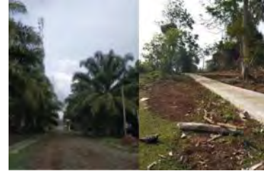
Gambar 3. Jalan Akses Pejalan Kaki

Ketersediaan akses pejalan kaki di lokasi wisata dapat dijangkau oleh masyarakat dengan aman dan nyaman. Ketersediaan akses kendaraan yang mampu menjangkau lokasi wisata dan dapat berpindah tempat dengan leluasa.