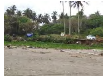
Gambar 5. Ketersediaan Ruang Publik

Indikator ketersediaan ruang publik dapat dilihat dari fasilitas sarana dan prasarana pendukung wisata seperti taman, parkir, plaza, tempat ibadah, dll.