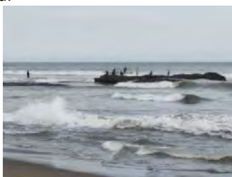
Gambar 6. Warga Setempat Bekerja Memancing Ikan

Air sebagai tempat bekerja masyarakat setempat dan rekreasi untuk pengunjung wisata.