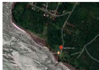
Gambar 1. Batasan Kawasan Penelitian

Lokasi penelitian yaitu Pantai Tapak Batu di Desa Pasar Lais, Kecamatan Lais, Kabupaten Bengkulu Utara, Bengkulu. Pemilihan lokasi tersebut karena kawasan Tepi Pantai Tapak Batu di Bengkulu Utara dapat dikembangkan, mengingat lokasinya yang strategis dan pantai ini menjadi lokasi rekreasi pemuda-pemudi setempat. Pantai ini juga diadakan acara tahunan disetiap hari raya Idul Fitri. Setiap tahunnya ada peningkatan pengunjung di pantai ini.