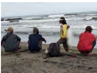
Gambar 7. Warga Setempat Bekerja Menjaring Ikan