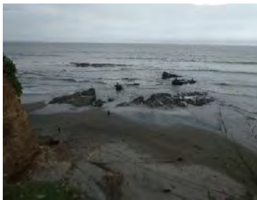
Gambar 2. Tapak Batu

Hasil dari pengumpulan data kuesioner responden diatas dapat disimpulkan bahwa Wisata Rekreasi Tepi Pantai Tapak Batu ini memiliki daya tarik yang berbeda dari pantai lainnya di Bengkulu Utara. Daya tarik yang sangat menarik untuk menjadi salah satu destinasi wisata air dalam mendukung Kota Bengkulu Utara sebagai Waterfront city .