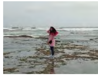
Gambar 8. Pengunjung Wisata Pantai Tapak Batu