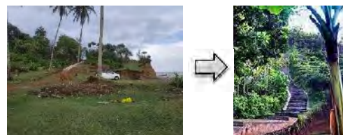
Gambar 9. Akses Pejalan Kaki

Berikut konsep yang ingin penulis terapkan untuk mengoptimalkan pemanfaatan kawasan tepi pantai tapak batu dengan menggunakan variabel konsep dari Nicholas Falk 2002: