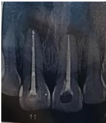
Gambar 3 : Foto radiografi saat pengepasan gutta percha