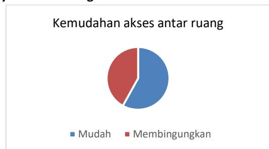
Gambar 23. Bagan Kemudahan Akses Antar Ruang (Sumber: analisis penulis, 2021)

18 responden merasa akses antar ruang mudah, namun 13 responden mengatakan akses antar ruang membingungkan. Responden yang merasa mudah disebabkan oleh adanya petugas yang mengarahkan dan membaca petunjuk arah yang disediakan. Sedangkan, responden yang merasa bingung disebabkan oleh petunjuk arah yang terlalu kecil dan kurang menarik perhatian.