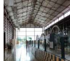
Gambar 11. Kaca Sebagai Pencahayaan Alami

Kaca sebagai pencahayaan alami, lampu sorot pada museum, dan penggunaan warna cerah pada interior dan eksterior yang memunculkan kesan tenang dan elegan.