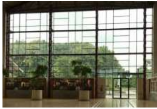
Gambar 4. Kaca Pemantul Panas