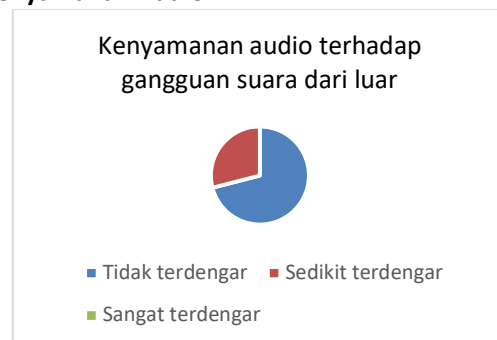
Gambar 18. Bagan Kenyamanan Audio

22 responden tidak mendengar gangguan suara dari luar, 9 responden mendengar sedikit gangguan suara dari luar tetapi semuanya masih dalam kategori nyaman, dan 0 responden sangat mendengar gangguan suara dari luar. Hal ini disebabkan oleh jarak bangunan yang jauh, rumput sebagai penutup permukaan tanah dan