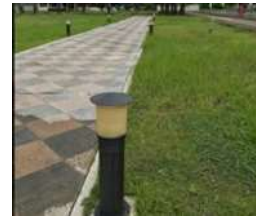
Gambar 8. Rumput Sebagai Elemen Penyerap Bunyi