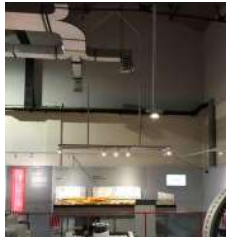
Gambar 6. Penggunaan AC Split