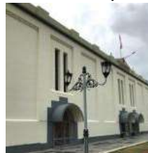
Gambar 13. Warna Cerah Pada Eksterior SIAR II 2021: SEMINAR ILMIAH ARSITEKTUR | 20