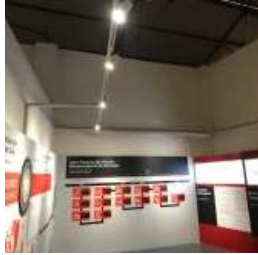
Gambar 14. Warna Cerah Pada Interior