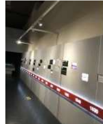
Gambar 12. Lampu Sorot Pada Museum