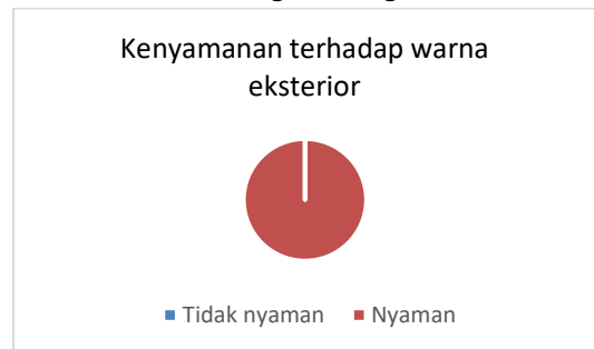
Gambar 22. Bagan Kenyamanan Warna Interior

0 responden merasa tidak nyaman dengan pemilihan warna interior. Sehingga, 31 responden merasa nyaman dengan warna yang dipilih karena memberikan kesan tenang dan elegan.