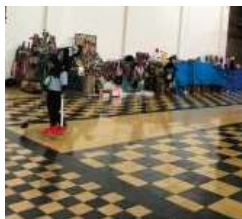
Gambar 16. Dimensi Ruang