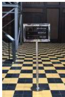
Gambar 15. Petunjuk Arah

Meletakkan petunjuk arah dan dimensi ruang yang besar.