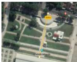
Gambar 7. Jarak Bangunan Terhadap Sumber Bunyi

Jarak bangunan dengan sumber bunyi, elemen rerumputan sebagai penyerap bunyi, halangan alami berupa pohon dan halangan buatan berupa tembok pagar.