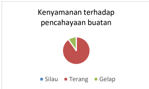
Gambar 19. Bagan Kenyamanan Terhadap Pencahayaan Alami

0 responden merasa silau terhadap pencahayaan alami, 28 responden merasa terang, dan 3 responden merasa gelap. Hal ini disebabkan oleh bukaan alami yang kurang merata dan dimensi ruang yang besar sehingga mengakibatkan masuknya sinar kurang merata di setiap ruang.