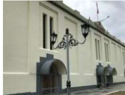
Gambar 5. Warna Cerah Pada Eksterior