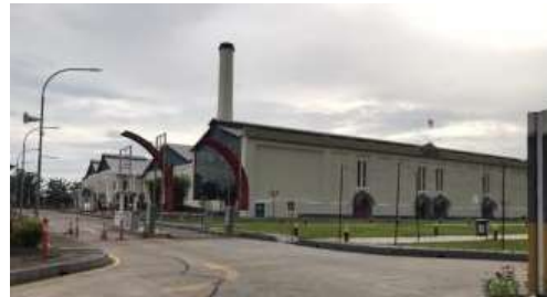
Gambar 1. De Tjoloamdoe

Pada 1997 terjadi krisis moneter yang mengakibatkan Pabrik Gula Colomadu berhenti produksi dan menjadi tidak terawat. Pada tahun 2017 pemerintah merevitalisasi bangunan pabrik menjadi tempat kegiatan MICE (Meetings, incentives, conferences and exhibitions) karena sudah tidak memungkinkan untuk digunkaan menjadi pabrik seperti sedia kala.