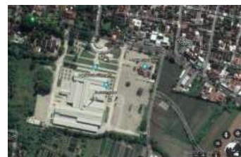
Gambar 2. Orientasi Bangunan

Orientasi bangunan yang menghadap utara, penambahan elemen arsitektur sirip pada pintu, menyorokkan jendela sedikit kedalam guna meminimalisir panas matahari yang masuk, pemilihan material bangunan menggunakan kaca yang memantulkan panas matahari, pemilihan warna cerah agar penyerapan panas matahari rendah, dan penggunaan AC Split .