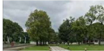
Gambar 9. Pepohonan Sebagai Halangan Alami