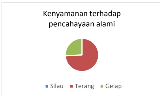
Gambar 20. Bagan Kenyamanan Terhadap Pencahayaan Buatan

0 responden merasa silau terhadap pencahayaan alami, 28 responden merasa terang, dan 3 responden merasa gelap. Hal ini disebabkan oleh bukaan alami yang kurang merata dan dimensi ruang yang besar sehingga mengakibatkan masuknya sinar kurang merata di setiap ruang.