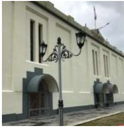
Gambar 3. Sirip Pada Pintu dan Jendela Yang Menjorok