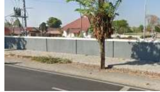
Gambar 10. Tembok Pagar Sebagai Halangan Buatan