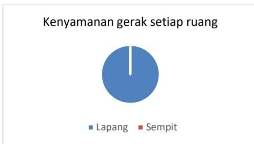
Gambar 24. Bagan Kenyamanan Gerak Setiap Ruang

31 responden merasakan kenyamanan gerak pada setiap ruang. Hal ini disebabkan oleh ukuran ruang yang besar dan penempatan perabot yang baik sehingga menciptakan kenyamanan gerak.