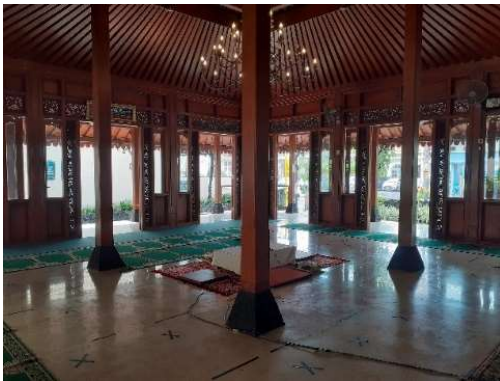
Gambar 3. Interior Masjid Jannatul Firdaus

Interior masjid didominasi dengan material kayu. Mulai dari pintu, jendela, hingga langit-langit masjid terbuat dari kayu. Sedangkan marmer berukuran 60 cm x 60 cm dipilih sebagai pelapis pada bagian bawah bangunan. Selain digunakan sebagai unsur keindahan, marmer dipilih karena sifatnya yang dapat menurunkan suhu ruangan.