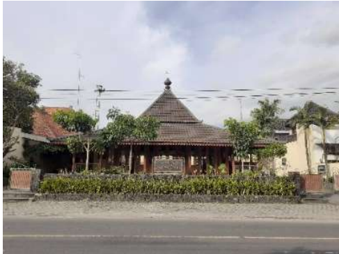
Gambar 2. Tampak depan Masjid Jannatul Firdaus

tanaman jenis perdu yang berperan sebagai berier sekaligus estetika pada masjid. Masjid ini berarsitektur tradisional jawa serta menghadap langsung ke jalan raya, maka tidak heran jika masjid ini menarik perhatian dan mudah ditemukan.