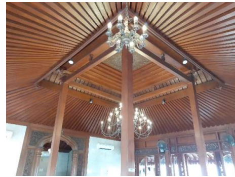
Gambar 4. Langit-langit pada Masjid Jannatul Firdaus

Jenis bukaan pada Masjid Jannatul Firdaus adalah pintu, jendela, serta roster. Pintu dan jendela terdiri dari material kaca dan kayu sebagai kusennya. Sedangkan roster sendiri terbuat dari kayu jati yang diukir hingga terdapat celah atau lubang yang membuat roster tersebut dapat mengalirkan udara.