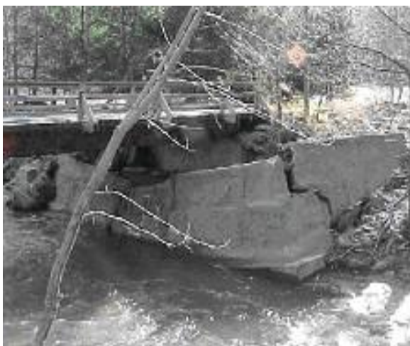
Gambar 1. Rusaknya fondasi abutmen jembatan akibat gerusan oleh debit banjir.

memiliki derajat toleransi terhadap penggenangan air yang berlainan dengan derajat toleransi akar tumbuh-tumbuhan; lamanya penggenangan air; kerusakan atau derajat kerusakan bangunan, infrastruktur dan tumbuh-tumbuhan sering berkaitan dengan jangka waktu berlangsungnya penggenangan air. Arus air yang besar akan berbahaya dan mengakibatkan daya pengikisan sangat besar (erosi dan abrasi) serta peningkatan tekanan dinamika air sehingga pondasi bangunan dan infrastruktur menjadi lemah / rusak, lihat Gambar 1. Hal ini bisa terjadi dilembah bantaran sungai, pantai dan tepian sungai. Perkiraan tentang tingkat kenaikan permukaan air sungai (perubahan muka air sungai) sangat penting sebagai dasar peringatan bahaya banjir, rencana pengungsian dan pengaturan tata ruang daerah. Hal ini bisa didapat dari data-data lapangan terdahulu baik lewat survey maupun wawancara dengan masyarakat setempat di daerah banjir atau melalui analisis banjir rencana dari data-data hidrologi yang ada.