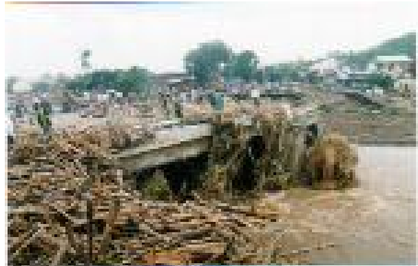
Gambar 3. Lubang jembatan tertutup sampah dan limbah kayu, kasus banjir bandang pada kali Sampean di Situbondo (Jaji dan Kirno, 2002)

Akibat bencana banjir, bangunan-bangunan akan rusak atau hancur yang disebabkan oleh daya terjang air banjir, terseret arus, daya kikis genangan air, longsornya tanah di seputar/di bawah pondasi, tertabrak/terkikis oleh benturan dengan benda-benda berat yang terseret arus, lihat Gambar 3. Kerugian fisik cenderung lebih besar bila letak bangunan di lembah-lembah pegunungan dibanding di dataran rendah terbuka. Banjir dadakan akan menghantam apa saja yang dilaluinya.