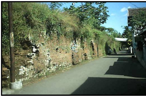
Gambar 1. Geger Pecinan Tahun 1742

Kota Solo telah banyak mengalami bencana ruang kota dalam sejarah perkembangannya. Setidaknya ada tiga peristiwa tragedi besar yang tercatat dalam sejarah kotanya (lihat Gambar 1-3 ), yaitu: (1) Geger Pecinan tahun 1742; (2) Boemi Hangoes tahun 1948; dan (3) Kerusuhan Massal tahun 1998. Tiga tragedi itu telah membuat kemerosoton kualitas ruang kota, baik pada elemen fisik kota (seperti rumah yang hancur, kantor yang gosong, pasar yang hangus, rusaknya jalan dan instalasi) maupun pada elelemen non-fisik kota (seperti retaknya kohesi sosial, krisis ekonomi yang panjang, degradasi hukum dan etika).