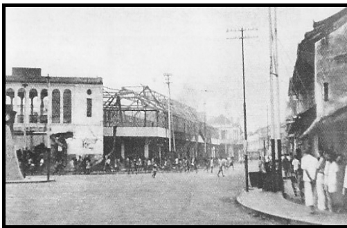
Gambar 2. Boemi Hangoes Tahun 1948

Pada tahun 1700-an, kawasan Kota Solo sudah dihuni oleh 4 bangsa yang berbeda, yaitu Belanda, Cina, Arab dan Pribumi. Peristiwa pembunuhan massal ras Cina oleh ras Belanda di Jakarta tahun 1741 dibalas oleh ras Cina di Solo tahun 1742 melalui bantuan pangeran Kerajaan Mataram Kartasura, yang kemudian disebut sebagai peristiwa Geger Pecinan . (Keterangan: Foto Eks-Keraton Kartasura, diambil pada tahun 2007 oleh Penulis).