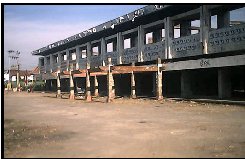
Gambar 3. Kerusuhan Massal Tahun 1998

Pada tahun 1948, seiring dengan era kemerdekaan RI, maka untuk mencegah kembalinya Belanda bersarang di Kota Solo, tentara pribumi yang dipimpin oleh Slamet Riyadi membakar gedung-gedung milik Belanda ( Politik Boemi Hangoes ). Bangunan-bangunan penting seperti pasar, kantor, stasiun, toko dll hangus terbakar. (Keterangan: Foto Kawasan Pasar Gede, diambil pada tahun 1949 oleh J. Anten, tersimpan di Arsip Mangkunegaran).