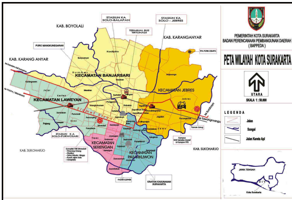
Gambar 1.5. Peta Wilayah Kota Solo