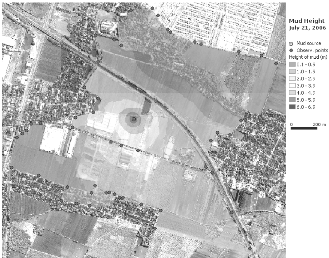
Gambar 2: Peta lokasi pengukuran dan sebaran ketinggian lumpur.