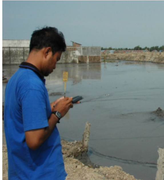
Gambar 1: Mengukur ketinggian lumpur dan menyimpan posisi geografis

Global Positioning Systems (GPS), Personal Digital Assistance (PDA) dan digital camera. GPS yang digunakan adalah GPS 10 Garmin sedang PDA yang digunakan adalah HP Ipaq 12cx. Fungsi dari PDA adalah untuk menyimpan koordinat lokasi pengukuran dari GPS ke dalam file dengan format shapefile . Koneksi tanpa kabel bluetooth digunakan untuk menghubungkan antara GPS dan PDA. Selain itu, ketinggian genangan lumpur dan kondisi lokasi juga dicatat dalam basis data dari shapefile . Pengambilan data dengan metode ini sangat cepat sehingga data bisa diproses langsung dengan perangkat lunak SIG.