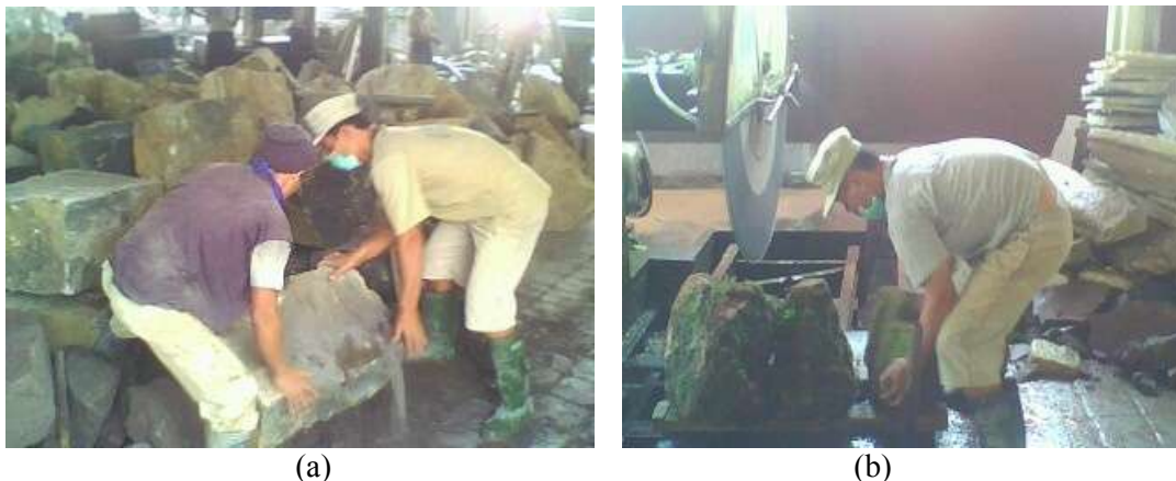
Gambar 1. Posisi kerja operator, (a) pengangkutan batu (b) pengaturan posisi batu

Kondisi kerja tersebut terlihat membutuhkan energi yang banyak untuk melakukan pekerjaan ini. Apalagi pekerjaan ini dilakukan secara terus-menerus tanpa adanya waktu istirahat yang cukup bagi operator selama jam kerja. Operator melakukan istirahat dengan cara mencuri waktu istirahat selama bekerja sebesar 3 menit setiap jamnya. Hal ini dapat memungkinkan timbulnya beban kerja yang tinggi sehingga dapat menimbulkan kelelahan bagi tubuh yang dapat menyebabkan tingkat performansi kinerja operator mesin pemotong tersebut dapat menurun. Kebisingan yang diakibatkan oleh proses pemotongannya mencapai 112,1 dBA sehingga menimbulkan suara bising yang tak terkendali. Gambar 1 menunjukkan aktifitas operator saat pengangkutan dan pemasangan batu sirkel 60 cm pada mesin pemotong.