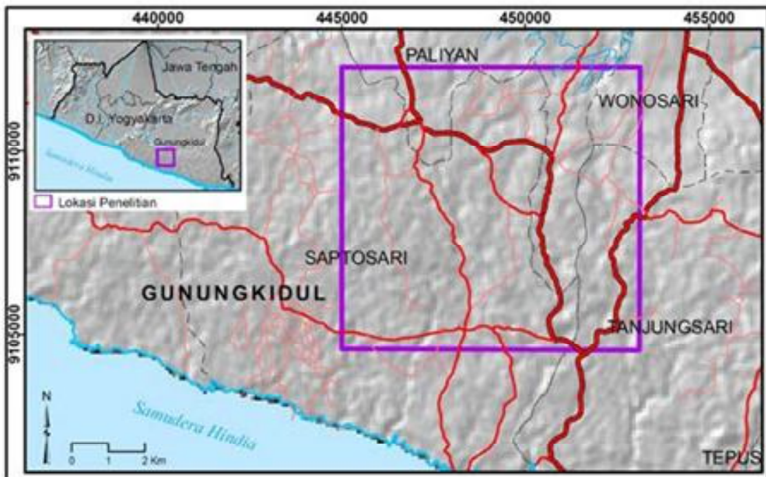
Gambar 1. Lokasi Kajian Penelitian

Penelitian ini bertujuan untuk mengetahui pengaruh kondisi meteorologis terhadap ketersediaan air telaga di kawasan karst Gunungsewu Kabupaten Gunungkidul. Penelitian ini diharapkan dapat digunakan