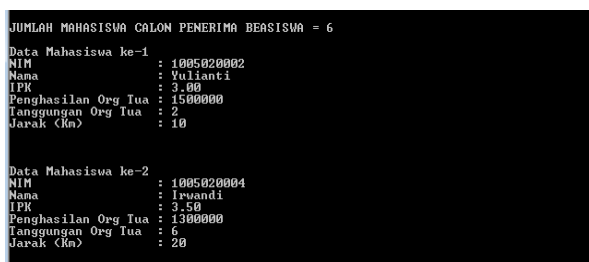
Gambar 3.1 Tampilan input alternatif

Pada Gambar 3.1 di atas merupakan tampilan dari input alternatif dengan data yang diuji yaitu 6 alternatif. Sedangkan data yang dinilai pada setiap alternatif yaitu ipk ( C_1 ), penghasilan orangtua ( C_2 ), tanggungan orangtua ( C_3 ) dan jarak ( C_4 ). Adapun untuk nim dan nama hanya dipakai sebagai keterangan untuk membedakan alternatif satu dengan alternatif lainnya.