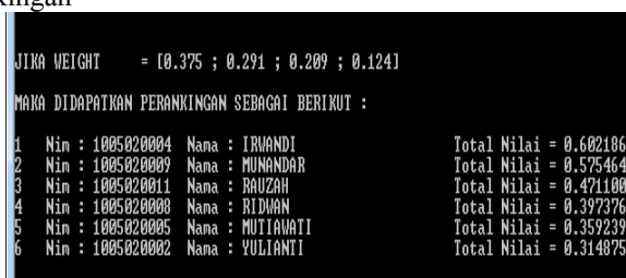
Gambar 3.3 Tampilan output hasil perankingan

Sedangkan pada gambar 3.3 di atas, merupakan hasil akhir yang diberikan oleh program penentuan calon penerima beasiswa. Sebagaimana terdapat dalam tampilan gambar program di atas, merupakan hasil akhir setelah matrik keputusan di peroleh. Di akhir program ini menjelaskan proses perankingan menggunakan Analytic Hierarchy Process (AHP).