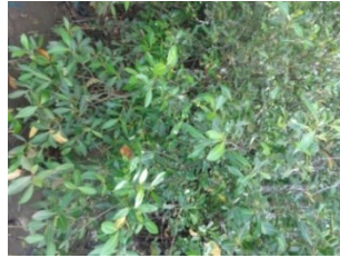
Gambar 1. Bentuk pohon Avicennia alba sp

Merupakan tanaman mangrove yang tumbuh menyebar mencapai ketinggian 25 m. memiliki betuk pohon serta akar napas berbentuk jari yang ditutupi lenti sel. Memiliki warna keabu-abuan/kecoklatan. Pada bagian daun memiliki bentuk lanset ujung maruncing permukaan bagian atas halus hijau mengkilat dan bagian bawah pucat serta memiliki letak yang berlawanan dengan ukuran 16 x 5 cm. pada bagian bunga berbentuk seperti trisula dengan formasi 10-30 bunga pertandan. Pada bagian buah berbentuk kerucut dengan ukuran 4 x 2 cm (Thomlinson 1986).