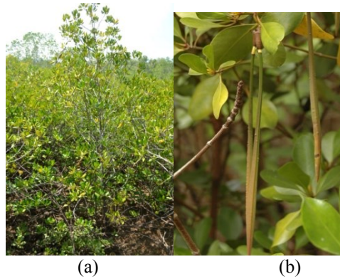
Gambar 8. (a) Bentuk pohon Ceriops tagal sp (b) buah Ceriops tagal sp