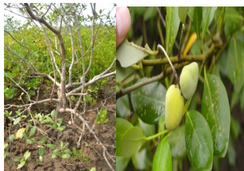
Gambar 2. (a) bentuk pohon Avicennia marina sp , (b) buah Avicennia marina sp

Merupakan tanaman mangrove yang tumbuh menyebar mencapai ketinggian 30 m. Memiliki bentuk pohon serta akar napas berbentuk pensil horizontal dengan beberapa lenti sel. Memiliki warna hijau abu abu dengan permukaan halus disertai burik. Pada bagian daun memiliki bentuk elips ujung maruncing hingga membulat permukaan bagian bawah memiliki warna putih-abuabu muda serta memiliki letak yang berlawanan dengan ukuran 9 x 4,5 cm. Pada bagian bunga berbentuk seperti trisula dengan formasi 2-12 bunga pertandan. Pada bagian buah berbentuk agak membulat berwarna hijau keabu-abuan dengan ukuran 1,5 x 2,5 cm (Thomlinson 1986).