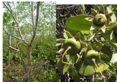
Gambar 10. (a) Bentuk pohon Sonneratia Alba sp (b) buah Sonneratia Alba sp Sumber: dokumen pribadi

Merupakan tanaman mangrove yang tumbuh mencapai ketinggian 15 m. Memiliki bentuk pohon kecil/semak serta memiliki akar nafas berbentuk seperti kabel. Memiliki warna putih tua hingga coklat. Pada bagian daun memiliki bentuk bulat telur terbalik dengan ujung membulat memiliki letak yang berlawanan dengan ukuran 5-12,5 x 3-9 cm. Pada bagian bunga dengan formasi kelompok 1-3 bunga berkelompok. Pada bagian buah berbentuk seperti bola dengan diameter 3,5-4,5 cm