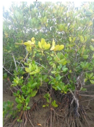
Gambar 9. Bentuk pohon Ceriops decandra sp

Merupakan tanaman mangrove yang tumbuh mencapai ketinggian 15 m. Memiliki bentuk pohon kecil/semak serta memiliki akar tunjang yang kecil. Memiliki warna abu abu putih kotor dan pada bagian pangkal menggebu. Pada bagian daun memiliki bentuk elips membulat dengan ujung membulat memiliki letak yang berlawanan dengan ukuran 3-10 x 1-4,5 cm. Pada bagian bunga dengan formasi kelompok 2-4 bunga berkelompok. Pada bagian buah berbentuk memanjang dengan kelopak melengkung memiliki hipokotil silinder dengan panjang 15 cm (Thomlinson 1986).