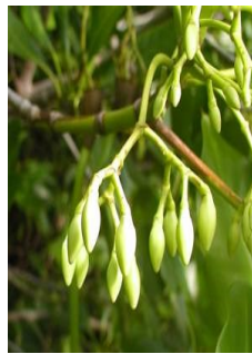
Gambar 4. bunga Rhizophora stylosa sp

Merupakan tanaman mangrove yang tumbuh mencapai ketinggian 10 m dengan diameter batang mencapai 50 cm. Memiliki bentuk pohon serta memiliki akar tunjang dan akar udara yang tumbuh dari cabang bawah. Memiliki warna abu abu tua. Pada bagian daun memiliki bentuk elips melebar dengan ujung meruncing permukaan memiliki warna hijau serta memiliki letak yang berlawanan dengan panjang 2,5-5cm. Pada bagian bunga berbentuk seperti cagak dengan formasi 8-16 bunga berkelompok. Pada bagian buah berbentuk bulat seperti buah pir berwarna kecoklatan dengan panjang 2,5 – 4 cm dan hipokotil silindris dengan leher kotiledon berwarna merah (matang) dengan panjang mencapai 38 cm (Thomlinson 1986).